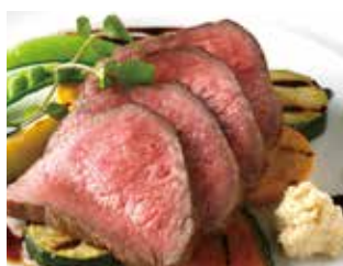
ローストビーフに